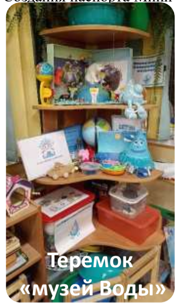
Теремок «музей Воды»