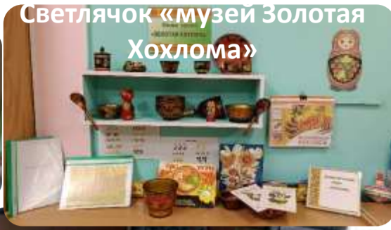
Светлячок «музей Золотая Хохлома»