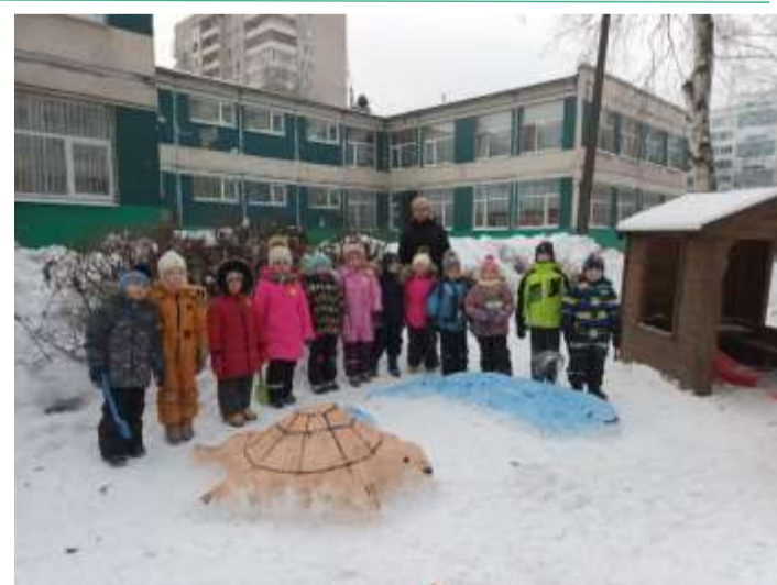
Старшая группа «Пчёлки» слепили прекрасные снежные скульптуры