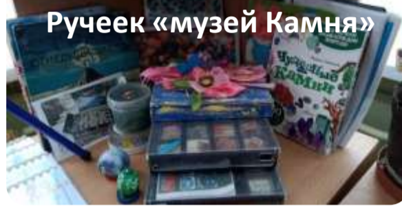
Ручеек «музей Камня»