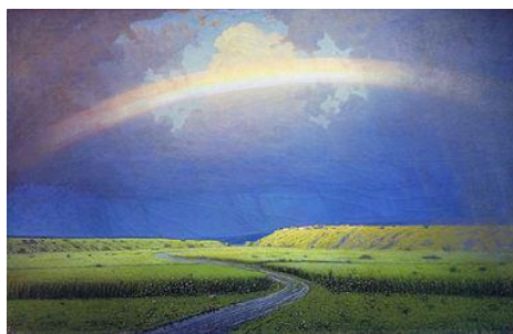
А Куинджи «Радуга»