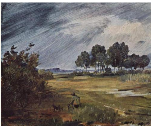
Вильгельм Буш «Пейзаж с дождем»